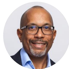
Чет Боулинг Партнер